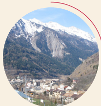
MODANE - FOURNEAUX